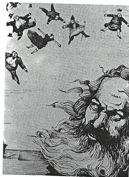
«Un fantasma recorre Europa. El fantasma del Comunismo.» Así empieza El Manifiesto Comunista

Con este propósito se han reunido en Londres comunistas de las más diversas nacionalidades y han redactado este manifiesto que se publicará en las lenguas inglesa, francesa, alemana, italiana, flamenca y danesa.