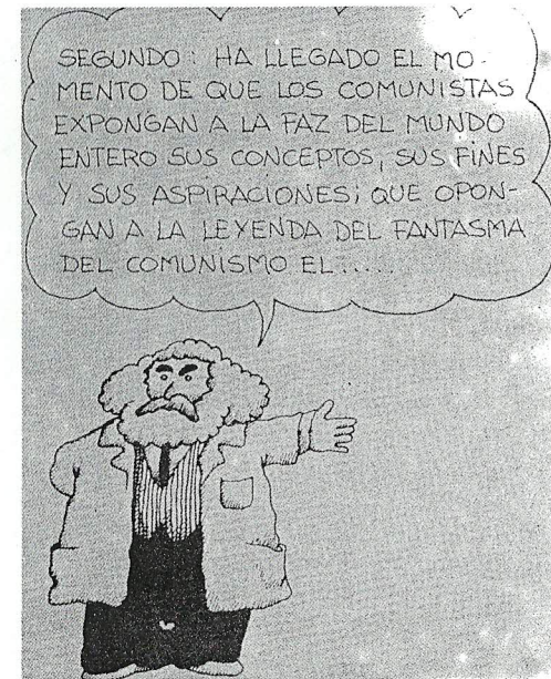
El Manifiesto Comunista, en cómic, dibujado por Ro Marcenaro.

De los siervos de la gleba medievales fueron surgiendo los pecheros de las primeras villas. A partir de éstos, fueron desarrollándose los primeros elementos de la burguesía 3 .