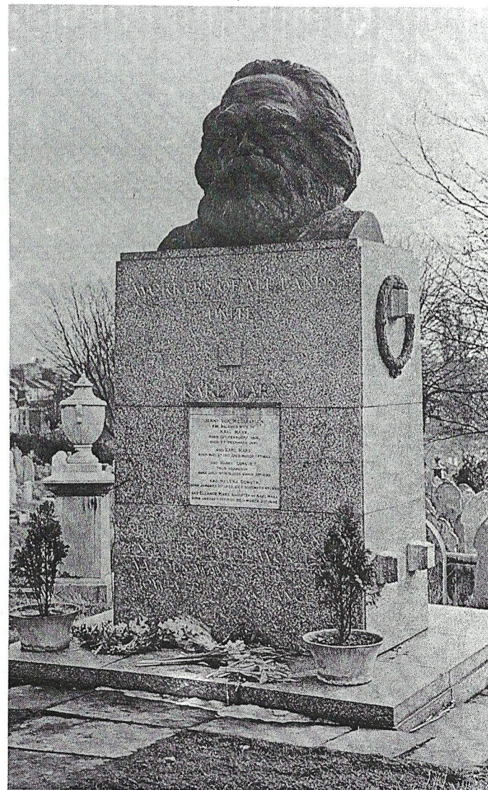
Segunda tumba de Marx, en Londres.

Todos los tipos de sociedad anteriores se basaban, como hemos visto, en el antagonismo entre clases opresoras y oprimidas. Pero para poder oprimir a una clase es preciso asegurarle las condiciones mínimas que le permitan arrastrar su vida de servidumbre. El siervo de la gleba fue capaz, merced al trabajo de su servidumbre, de elevarse a miembro de la comuna y el pequeño burgués, por su parte, se elevó a burgués bajo el yugo del absolutismo feudal. El obrero moderno, por el contrario, en vez de elevarse socialmente a medida que progresa