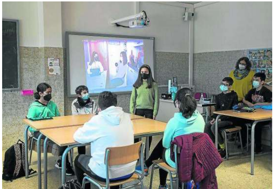
La exposición ante el grupo y la reflexión, bases de la metodología del instituto. TONI GALÁN

que muchas personas adultas, niños o adolescentes, como ellos mismos, sufren situaciones negativas por causa de la presencia dominante de un estereotipo. Es entonces cuando se favorece la empatía, porque el estereotipo es algo arbitrario e injustificado y a todo el mundo puede alcanzarle. A partir de ahí, el estereotipo pierde parte de su poder destructivo. Si no destructivo sí reduccionista. Porque la realidad es mucho