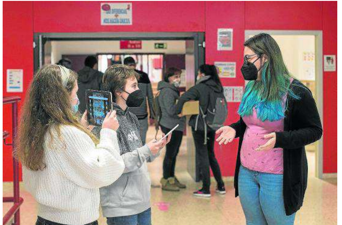
Los alumnos han entrevistado a docentes, compañeros, vecinos del barrio... TONI GALÁN

«A través de las entrevistas –explica Blanca Domínguez–, el alumnado se ha dado cuenta de