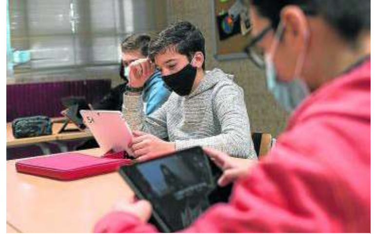
Los alumnos visualizan los vídeos que han realizado. TONI GALÁN

En estos momentos de incertidumbre, limitaciones y restricciones, el IES El Picarral ha optado por trabajar en proyectos de profundidad, por ahondar en las razones que nos llevan a hacer juicios sin argumentos que los sustentan, a rechazar al diferente, a excluir a los que no encajan en nuestras etiquetas. Un proyecto, precisamente, orientado a borrar