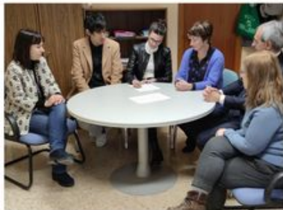
Nace Ainves, la primera asociación nacional por la investigación en Educación Secundaria | H.A.