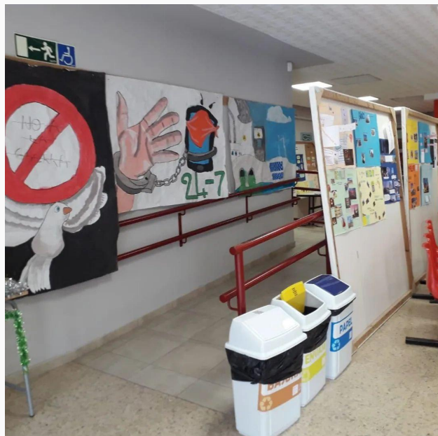
Tiempo de escuela