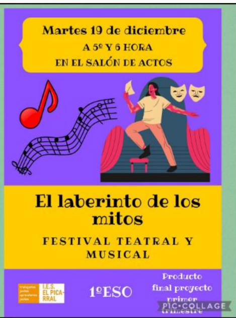
El laberinto de los Mitos